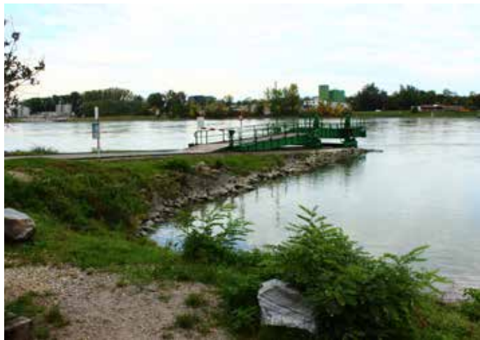
Von der Rollföhrensiedlung zum Tuttendörfel soll ein rund 450 Meter langer Versorgungstunnel Klosterneuburg mit Korneuburg verbinden. Geplanter Baustart ist im Mai 2021.

Alles andere als alltäglich ist das Bauvorhaben, mit dem die EVN an Klosterneuburg und Korneuburg herangetreten ist: Unter der Donau hindurch sollen die Versorgungssysteme der beiden Stadtgemeinden verbunden werden.