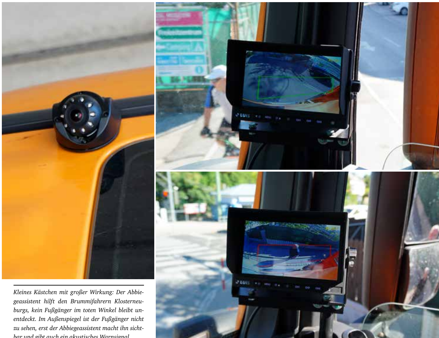
Kleines Kästchen mit großer Wirkung: Der Abbiegeassistent hilft den Brummifahrern Klosterneuburgs, kein Fußgänger im toten Winkel bleibt unentdeckt. Im Außenspiegel ist der Fußgänger nicht zu sehen, erst der Abbiegeassistent macht ihn sichtbar und gibt auch ein akustisches Warnsignal.

Ein kleines Kästchen für den LKW, ein großer Schritt zu mehr Verkehrssicherheit: Seit dem Sommer sind alle 17 Fahrzeuge der Stadtgemeinde über 7,5 Tonnen mit Abbiegeassistenten ausgestattet.