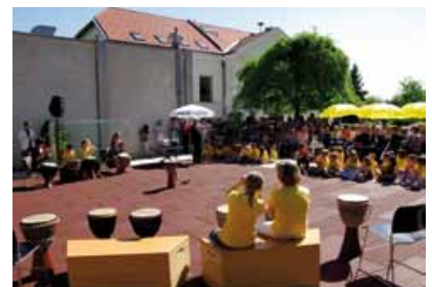
Bei sommerlichen Temperaturen konnten Kinder, Eltern und Lehrer den neuen Ballsportplatz gleich für das Eröffnungsfest nutzen.

Am 30. April bedankten sich die Kinder, Eltern und Lehrer bei sommerlichem Kaiserwetter mit einem Fest bei ihren Sponsoren. Mit den Darbietungen der Trommelgruppe, in Liedern und Tänzen gaben sie ihrer Freude Ausdruck und überreichten den Spendern köstliche Torten und Dankeskarten als Erinnerung an diesen besonderen Tag. Der Elternverein sorgte mit einem Buffet für das leibliche Wohl der Gäste.