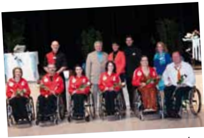
„Walzer trifft Tango“ lockte wieder zahlreiche Tanzbegeisterte in die Babenbergerhalle. Die gute Stimmung erreichte durch eine fantastische Darbietung der „Vienna Rolli-Dancedream“ ihren Höhepunkt. Die 3 Tanzpaare zeigten eindrucksvoll, wie schön tanzen auch im Rollstuhl sein kann. Der Reinerlös der Veranstaltung kommt dem Roten Kreuz Klosterneuburg zugute!