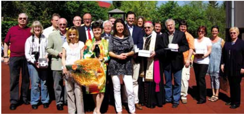
Die zahlreichen Sponsoren bekamen köstliche Torten und Dankeskarten als Erinnerung an diesen besonderen Tag.

Der Ballspielplatz der Volksschule Kritzendorf wurde bei einer Überprüfung im Vorjahr als nicht sanierbar beurteilt und nun durch eine Granulatmatten-Anlage ersetzt. Im Zuge eines großen Fests im Schulgarten wurde der neue Platz offiziell eröffnet.