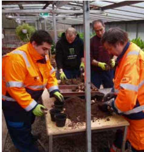
Die Stadtgärtner beim Eintopfen von 4.500 Canna.

Canna in Gelb, Orange und Rot werden von den Stadtgärtnern in diesem Frühling ausgepflanzt. Derzeit laufen die Topfarbeiten. Erstmals sorgen die Gärtner auch für die Pflege der Jungbäume. Den Bienen gibt eine neue Wiese in der Martinstraße Nahrung.